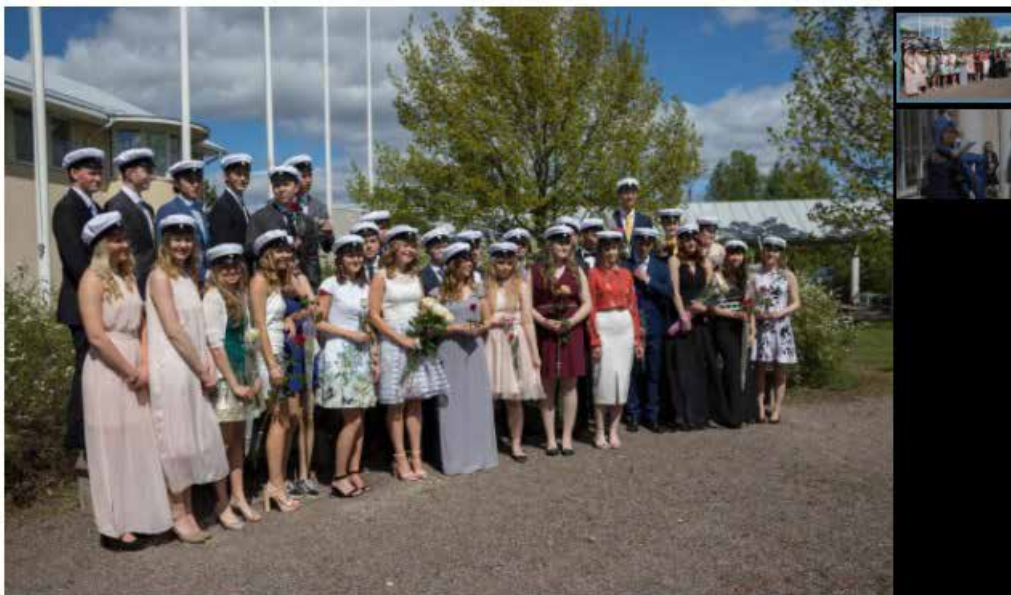
IDEL GLADA MINER. Sibbo gymnasiums trettiotvå nybakade studenter på rad.

NETTE BROMAN 4.6.2017 18:10 UPPDATERAD 4.6.2017 18:19