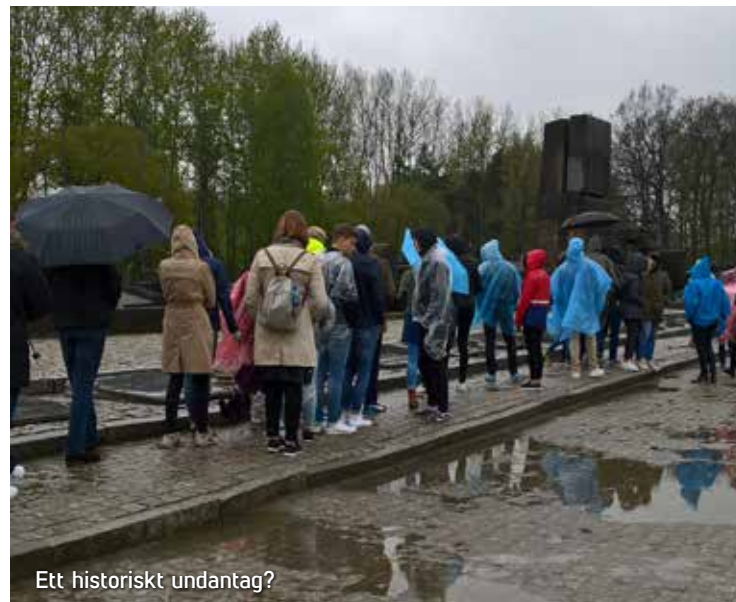
Ett historiskt undantag?